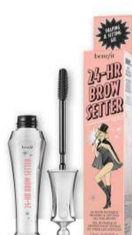
24h Brow Setter