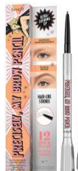
Precisely My Brow Pencil